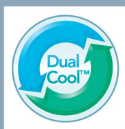
DualCool Technology™ 雙重涼感科技