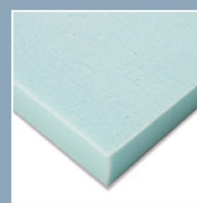
Surface Gel Technology Foam™ 涼感高科技泡綿