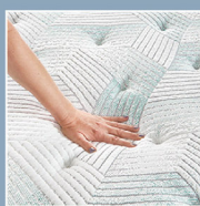
CoolTemp Technology 冷凝涼爽科技