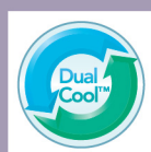
DualCool Technology™ 雙重涼感科技