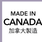
Made in Canada (加拿大製造)