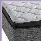
Pillow Top 舒適層