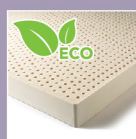
ECO Latex Foam 舒適順型乳膠